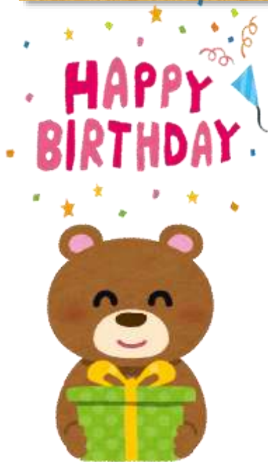
N・E 様 昭和4年9月88歳