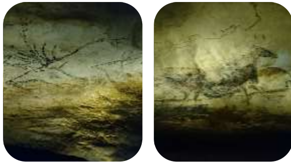
壁に描かれたオオツノジカの絵

壁画の壮大さはもちろんですが、壁画に使われた顔料（絵具）、石で作られたランプ、当時の人が身につけていた装飾品にもすっかり魅了され、2万年も前にこんなにも優れた文明が存在したことに驚愕でした。